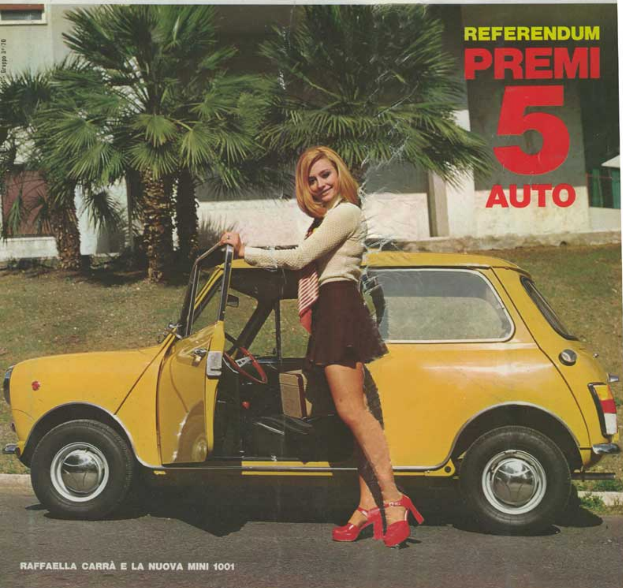
RAFFAELLA CARRÀ E LA NUOVA MINI 1001