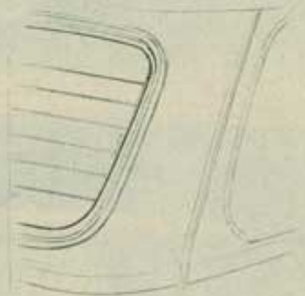
Le resistenze elettriche del lunotto termico.